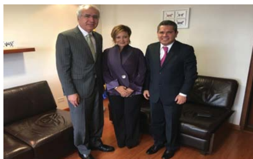
Visita Oficial del Embajador del Estado de Palestina.