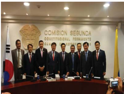
Visita Oficial Delegación de la Asamblea Nacional de Corea del Sur 09/08/16.