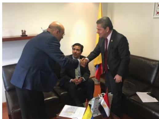
Visita del Embajador de la República Árabe de Egipto.