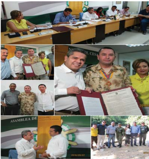
Sesión en el municipio de Valledupar-Cesar 08/09/16.