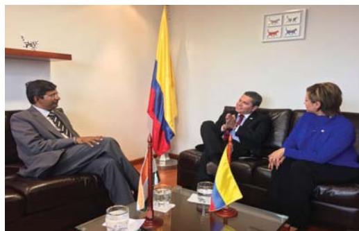
Visita del Embajador de la India para Colombia y Ecuador.