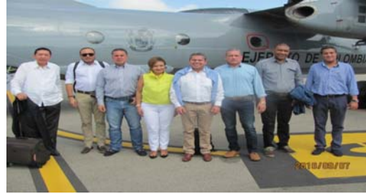
Honorables Representantes y Mesa Directiva de la Comisión en el Aeropuerto Alfonso López Villedupar-Cesar 08/09/16