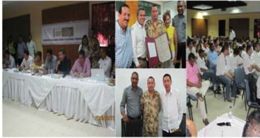
Sesión de la Comisión en el municipio de Maicao-La Guajira 22/09/16