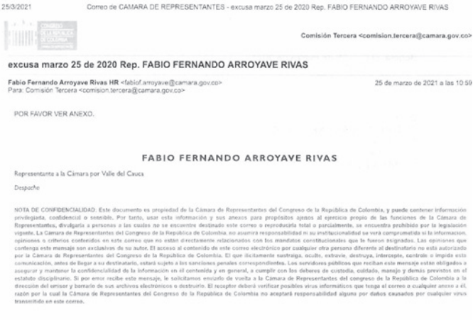
excusa comision tercera marzo 25 de 2021.docx

En total dos (2) honorables Representantes con excusa.