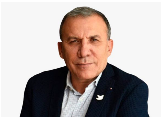
ROY LEONARDO BARRERAS MONTEALEGRE, PRESIDENTE DEL HONORABLE SENADO DE LA REPÚBLICA 20 DE JULIO DE 2022-20 DE JULIO DE 2023

“Si así fuere que Dios, esta Corporación y el pueblo os lo premien, y si no que Él y ellos os lo demanden” .