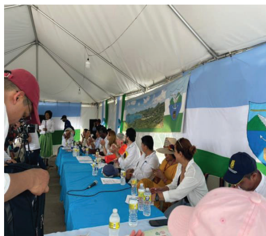
Fotografía No. 1. Comisión Séptima del Senado