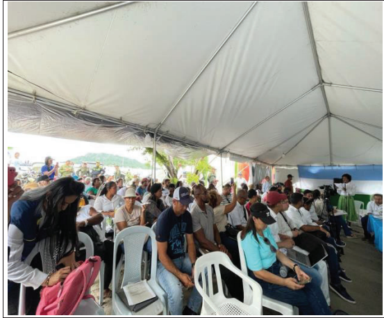
Fotografía No. 2. Comunidad raizal, líderes, líderes de la isla de San Andrés, Providencia y Santa Catalina

COMISIÓN SÉPTIMA CONSTITUCIONAL PERMANENTE DEL HONORABLE SENADO DE LA REPÚBLICA. - Bogotá D. C., A los veintisiete (27) días del mes de