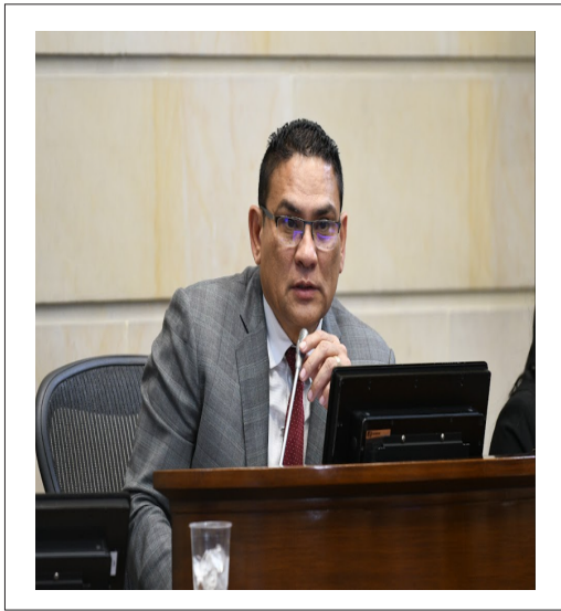
DÍDIER LOBO CHINCHILLA SEGUNDO PRESIDENTE DEL HONORABLE SENADO DE LA REPÚBLICA, PERÍODO 20 DE JULIO DE 2023 - 20 DE JULIO DE 2024

La Presidencia concede el uso de la palabra a la Primer Vicepresidenta del Senado electa, honorable Senadora María José Pizarro Rodríguez.