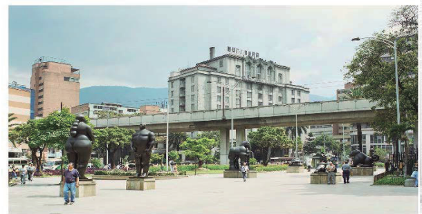
Las enormes esculturas de bronce de Fernando Botero se alinean en la Plaza Botero de Medellín. La plaza contiene obras donadas por el artista y fue renovada por él para tal fin.

Fueron en total 23 esculturas de bronce las que Fernando Botero generosamente aportó al corazón de Medellín, transformando un espacio urbano en un magnífico museo al aire libre, una expresión de su profundo afecto por su ciudad natal.