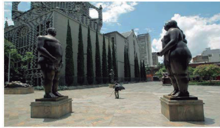
Plaza Botero y el Museo de Antioquia

Fueron en total 23 esculturas de bronce las que Fernando Botero generosamente aportó al corazón de Medellín, transformando un espacio urbano en un magnífico museo al aire libre, una expresión de su profundo afecto por su ciudad natal.