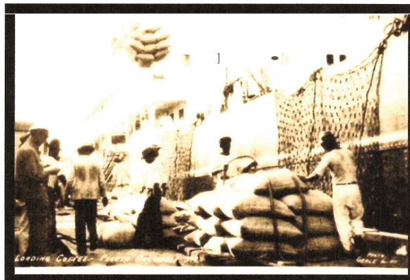
Imagen 2: Barcos descargando en el Puerto Colombia