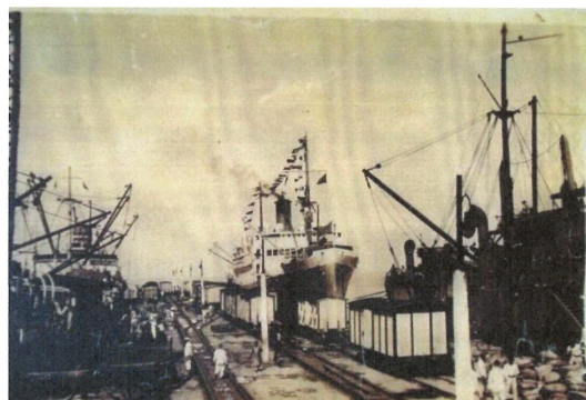
Imagen 4: Puerto de Puerto Colombia