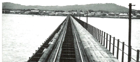
Imagen 3: Rieles del puerto