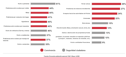
De enero a hoy, ¿cuáles de los siguientes problemas de violencia se le han presentado a los habitantes de este barrio?